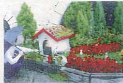
テーマ ~ 赤ずきんちゃん ~

世界を代表する8つの おとぎ話を季節の花や 植物で再現した ミニガーデンです。 物語の世界を思い浮か べながらのんびり巡ら せてね。(主人公になったつもりで...)